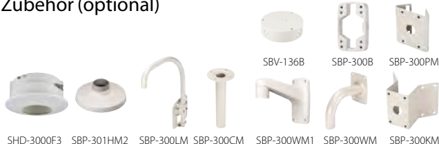
SHD-3000F3 SBP-301HM2 SBP-300LM SBP-300CM SBP-300WM1 SBP-300WM SBP-300KM